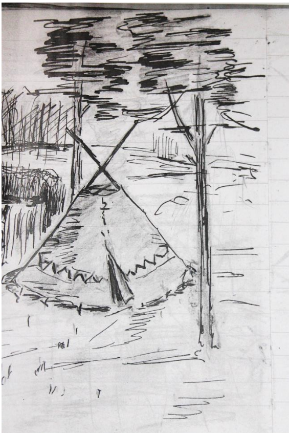
Eine Kohte. Zeichnung von Bringfried Naumann, Anfang der 1950er Jahre, aus seinem Handgeschriebenen Liederbuch.

Also: Der Altar gehört ins Zentrum. Die Gemeinde versammelt sich drumherum. Es gibt keinen besonderen Platz für das „liturgische Personal“. In Christus sind wir alle